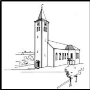
St. Martin – Kaltenbrunn