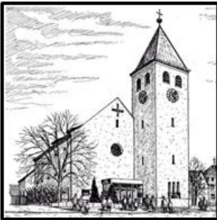
Herz Jesu - Kohlberg